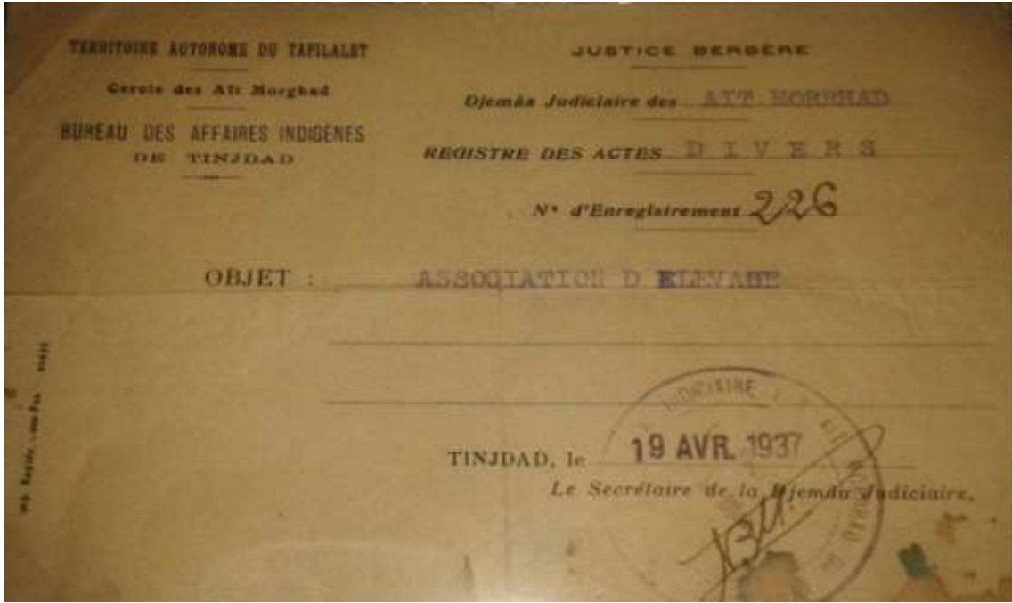
وثيقة رقم: (1)