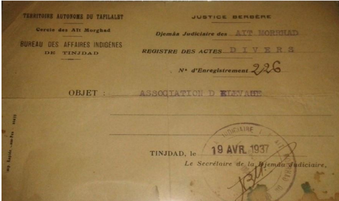
وثيقة رقم: (1)